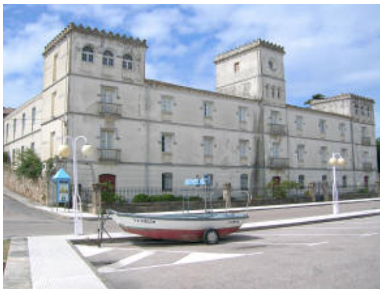
Imaxe actual do antigo campo de oncentración

Información tirada de: http://www.galicia-suroeste.com/fosa_comun.htm .