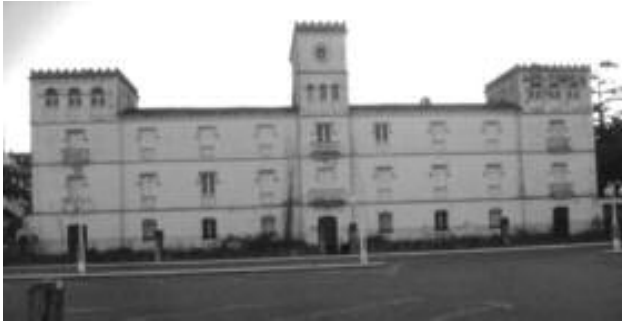
Centro de reclusión de detidos e sospeitosos no Colexio Apóstol Santiago dos PP. Xesuítas. O Pasaxe-Camposancos, máis tarde convertido en Campo de Concentración (A Guarda).